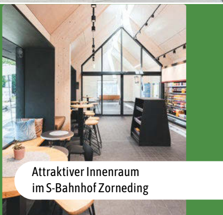
Attraktiver Innenraum im S-Bahnhof Zorneding

Seit letztem Jahr gibt es im S-Bahn-Gebiet zwei innovative kleine „grüne“ Bahnhöfe: Zorneding und Haar. Bei Bau, technischer Ausrüstung und Inneneinrichtung steht die Nachhaltigkeit im Mittelpunkt. Das Holz stammt aus der Region und die einzelnen Bauelemente wurden in einem traditionellen Holzbaubetrieb in Regensburg gefertigt.